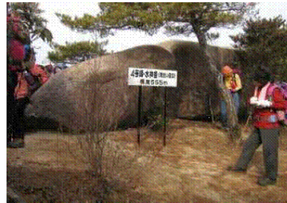
4号峰 水神釜(雨乞い信仰) 昼食です。