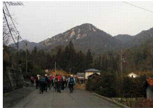
これから登る河平連山 44名です

松ヶ原 (9.30分) ~ 4号峰 (11.30分) 昼食~東登山口 (13時30分)