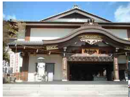
瑜伽大権現 蓮台寺