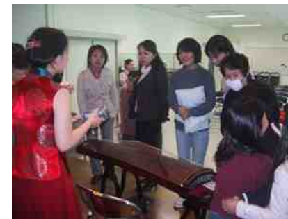
弦は21本 調弦は右側面をあけて